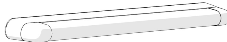
Schéma / Diagram