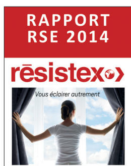
RAPPORT RSE 2014

Ce rapport a été vérifié par un organisme tiers indépendant au regard d'informations qualitatives et quantitatives relatives à chacune des thématiques de la Charte de responsabilité sociétale attachée au programme Performance Globale Paca-Est.