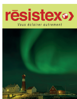
CATALOGUE RESISTEX 2016